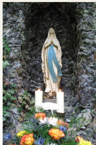
Lourdesgrotte in Erfenstein