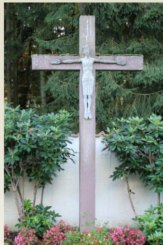
(H) Friedhofskreuz Kloster