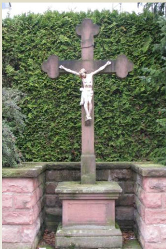
(F) Kreuz am Ortseingang