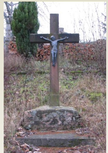
(I) Kreuz Aussegnungshalle