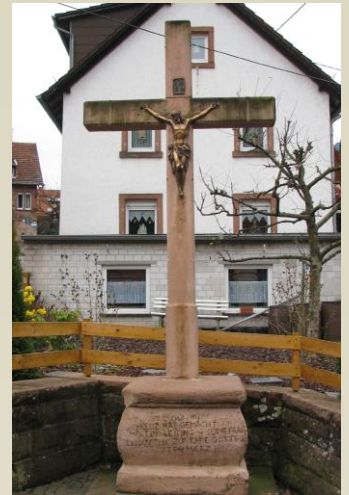
(E) Kreuz Kirchstraße