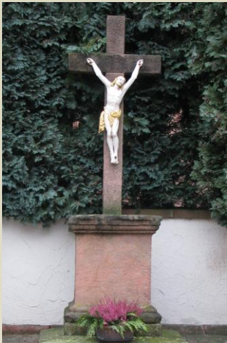
(B) Kreuz am Pfarrhaus