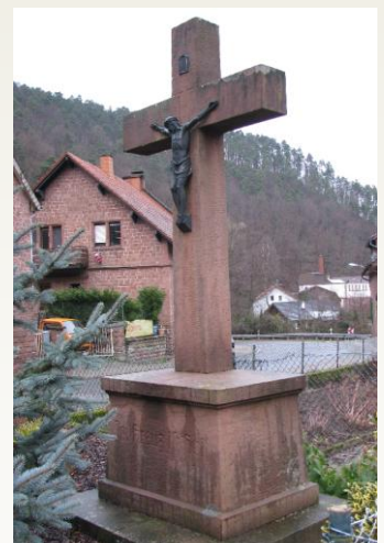
Wegkreuz in Erfenstein